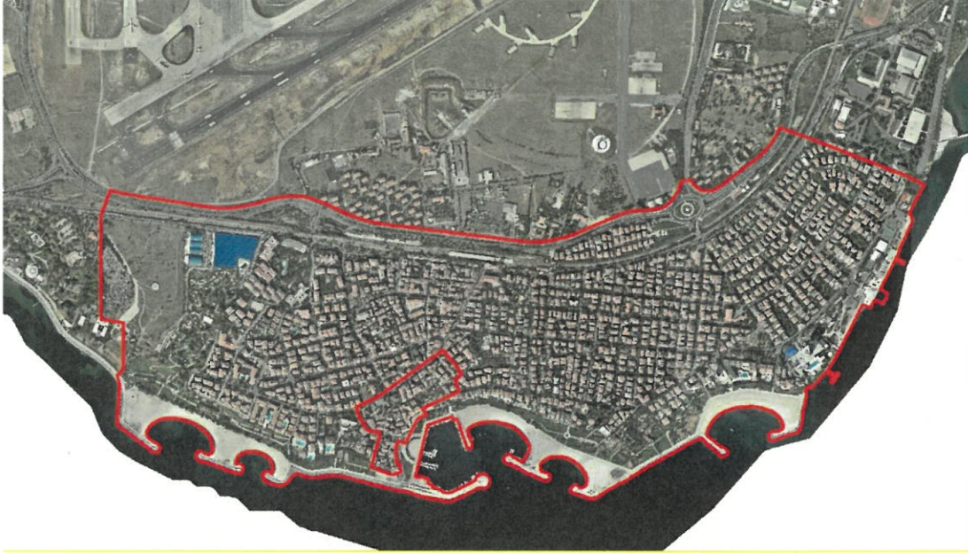
Şekil 1. Plan notu değişikliği teklifine konu alan sınırı

16.09.2007/21.07.2008/28.11.2012/18.05.2018/22.03.2021/17.10.2023 onanlı 1/1000 ölçekli Yeşilköy Uygulama İmar Planı/Tadilatlarını kapsayan plan değişikliğine konu alan, kuzeyde Atatürk Havaalanı, güneyde ve doğuda Marmara Denizi, batıda Florya ile sınırlı yaklaşık 250 ha.lık alandır.